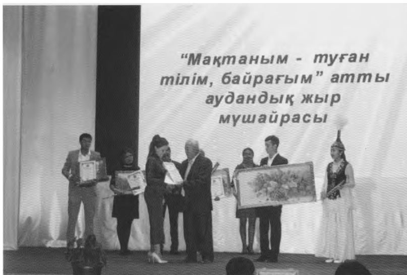
Аудандық жыр мүшайрасының марапаттау сәтінде