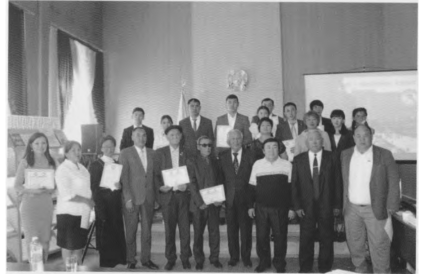
Шет ауданының 90 жылдық мерейтойына арналған мұшайрада ел ағалары, ақындармен

Еліме бақ дары, Қолдасын жан бәрі. Жасампаз жастармыз, Болашақ бағдары.