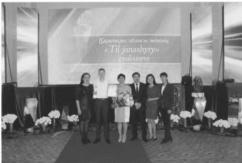
Қарағанды облысы әкімінің «Тіл жанашыру» сыйлығының марапаттауында