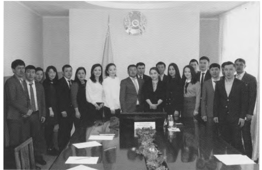
Шет ауданының жастарымен бірге іскерлік мақсаттағы бас қосуда